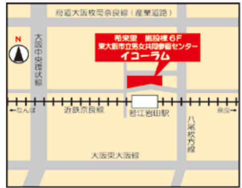
(近鉄奈良線 若江岩田駅前 希来里ビル施設棟6F)

休館日：月曜日(祝日・振替休日の場合は開館し、翌平日に休館) 及び年末年始(12月29日から1月3日)