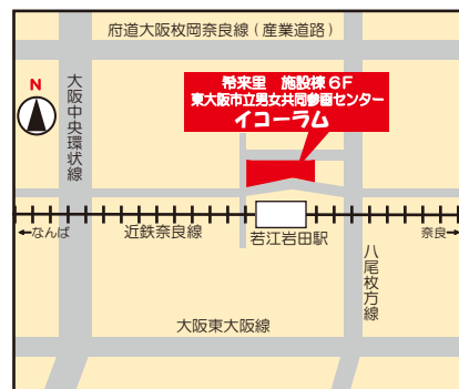
(近鉄奈良線 若江岩田駅前 希来里ビル施設棟6F)