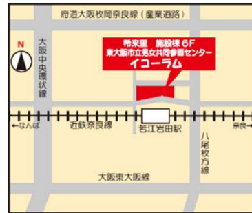
(近鉄奈良線 若江岩田駅前 希来里ビル施設棟 6F)