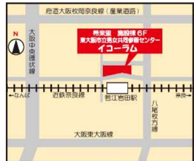
(近鉄奈良線 若江岩田駅前 希来里ビル施設棟 6F)