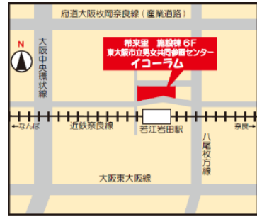
(近鉄奈良線 若江岩田駅前 希来里ビル施設棟 6F)